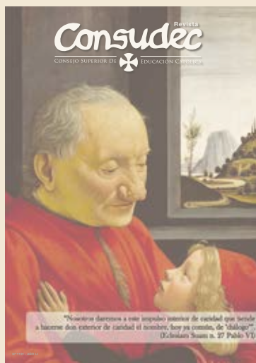
Pintura: Viejo con su nieto Autor: Domenico Ghirlandaio Se encuentra en el Museo del Louvre de París.